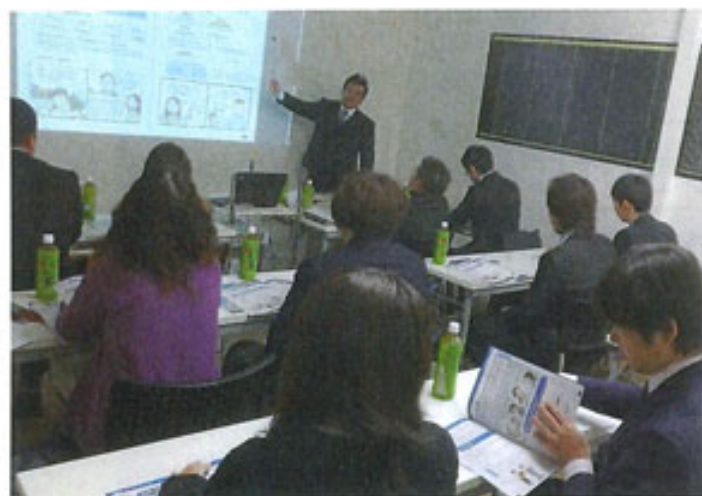
自社セミナーで講師をしている様子

税務の専門家。納税者の代わり に税金の申告などを行う税務 代理、税務書類の作成、税金 に関する相談に乗る税務相談 が独占業務となる。そのほか、 経営・相続・事業継承などの コンサルティング、国際税務、 会計業務の代行や指導など を行う。