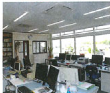
現在の事務所の様子

く、コストを下げるのがいか に利益につながるか」という、 ・コスト意識の大切さ。を学びま した。