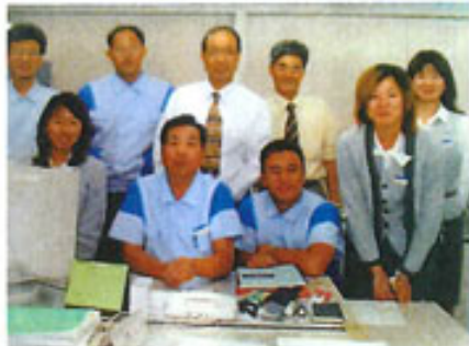
上)ハットリバー王国の国王と 下)前職の職場の皆さんと